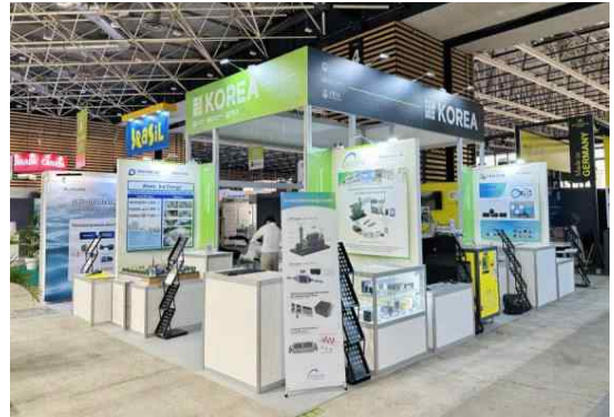
< 부스 디자인(예시) >